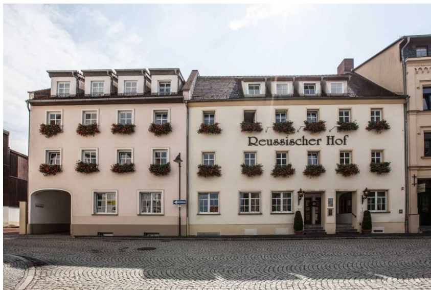
Hotel Reussischer Hof Schmölln